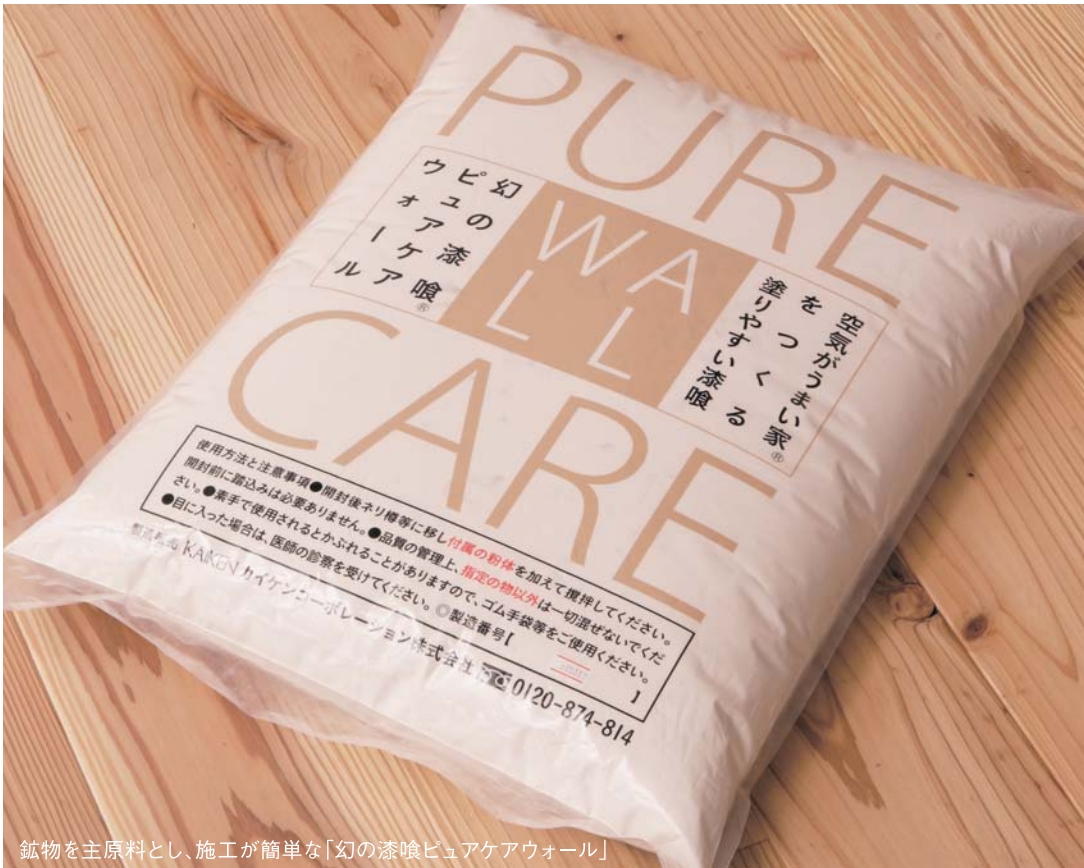
鉱物を主原料とし、施工が簡単な「幻の漆喰ピュアケアウォール」